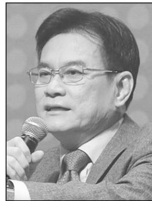
จรินทร์ ลักษณะวิศิษฎ์

ด้านนายจรินทร์ ลักษณะวิศิษฎ์ รองนายกรัฐมนตรีและรัฐมนตรีว่าการกระทรวงพาณิชย์ เปิดเผยในการเป็นประธานการประชุมมอบนโยบายเพื่อเชื่อมโยงการปฏิบัติงานของกระทรวงพาณิชย์และกระทรวงเกษตรและสหกรณ์ โดยมีผู้อำนวยการสำนักงานส่งเสริมการค้าในต่างประเทศ หรือทูตพาณิชย์ 58 แห่งทั่วโลก พาณิชย์จังหวัด และทูตเกษตรพร้อมทั้งผู้บริหารระดับสูงของกระทรวงพาณิชย์เข้าร่วม โดยการ