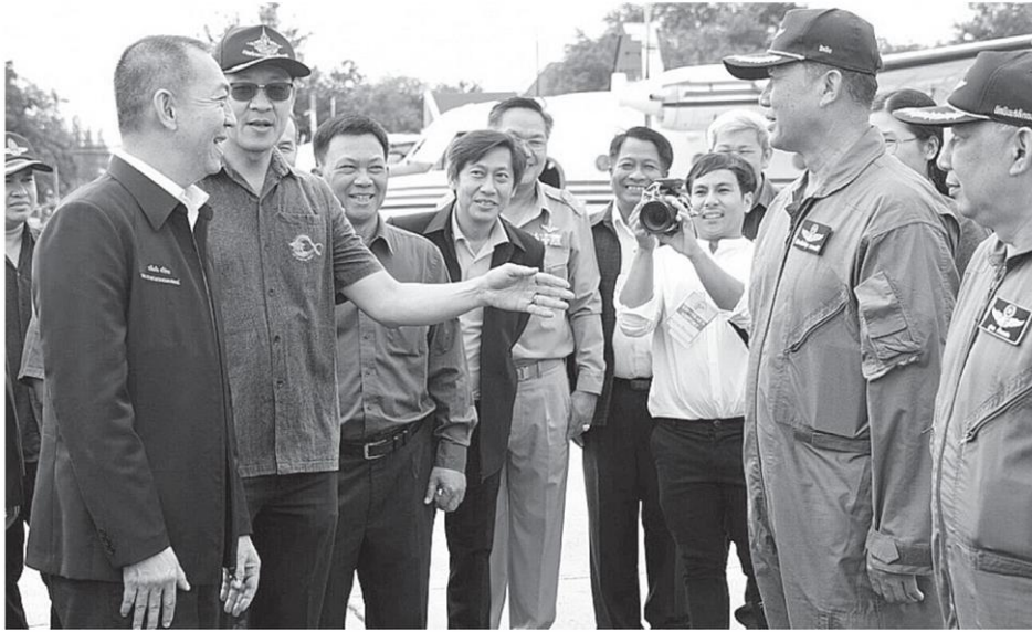
ติดตามฝนหลวง นายเฉลิมชัย ศรีอ่อน รัฐมนตรีว่าการกระทรวงเกษตรและสหกรณ์ ตรวจเยี่ยมให้กำลังใจเจ้าหน้าที่หน่วยฝนหลวงจังหวัดขอนแก่นที่ปฏิบัติหน้าที่อยู่ในพื้นที่ช่วยเหลือเกษตรกรให้พ้นวิกฤตภัยแล้ง หลังฝนทิ้งช่วงยาวนาน